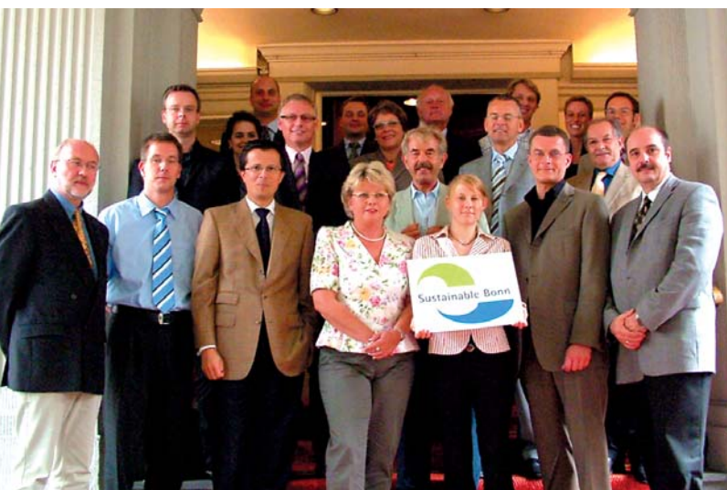
Die Teilnehmer von „Sustainable Bonn – Konferenzort der Nachhaltigkeit“, Bonn 2006 The participants of „Sustainable Bonn - Conference Location of Sustainability“, Bonn 2006